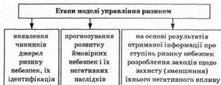
Рис. 1.3. Етапи моделі управління ризиком

Загалом усі ці етапи можна охарактеризувати як процес розробки й обґрунтування оптимальних програм діяльності" покликаних ефективно реалізувати рішення у сфері забезпечення безпеки (рис. 1.3):