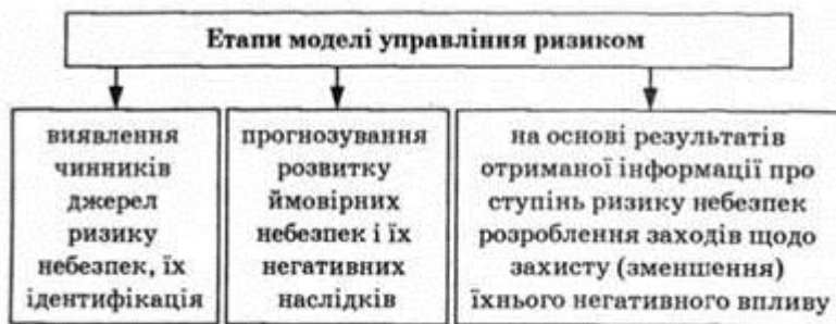
Рис. 1.3. Етапи моделі управління ризиком

Загалом усі ці етапи можна охарактеризувати як процес розробки й обґрунтування оптимальних програм діяльності" покликаних ефективно реалізувати рішення у сфері забезпечення безпеки (рис. 1.3):